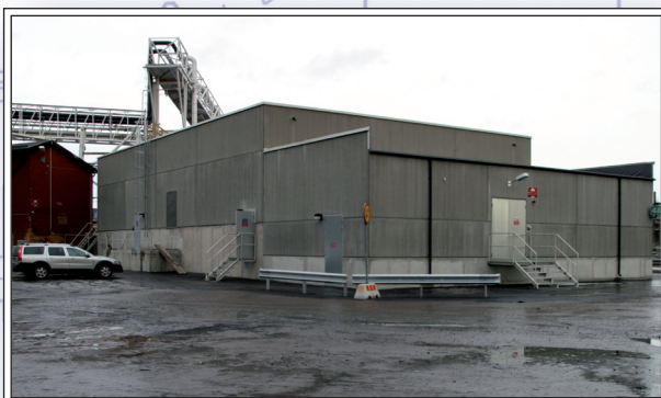
Älrvattenpumpstationen inom SSAB Tunnsplåt.

Allt färdigt material helbetas in- och utvändigt och kontrolleras för att säkerställa precision och kvalitet innan leverans. Björks Rostfria AB håller en mycket hög prefabriceringsgrad och montagetiderna blir därför mycket korta. Till det här projektet tillverkade vi rördelar i dimensionerna från 400 upp till 1200 mm i PN10, största godstjocklek var 20mm.