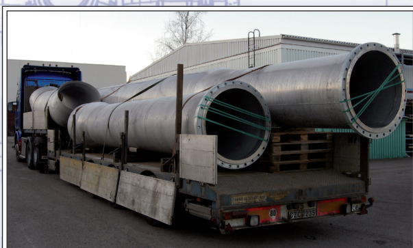
Tung transport till Borlänge.