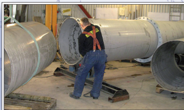
Prefabricering i egen verkstad.