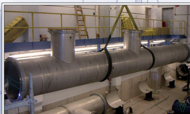
Montagearbete på plats.