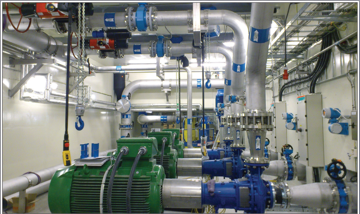
Tre pumpar tryckstegrar mot Grängesberg

För att få vattnet från Östansbo en och en halv mil bort till Grängesberg krävs tre stora pumpar. Höjdskillnaderna är också avsevärda.