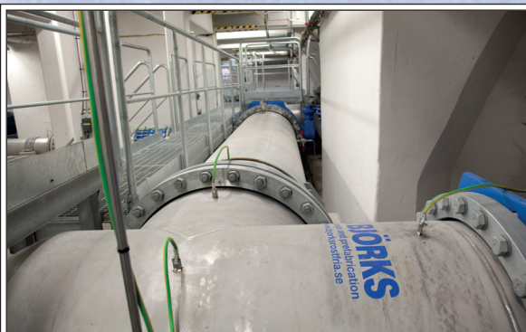
Distribution till pumpar