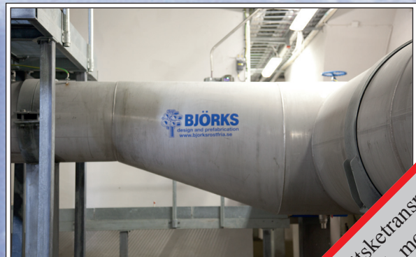
DN600 till 800