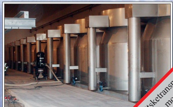
DN600 till 800