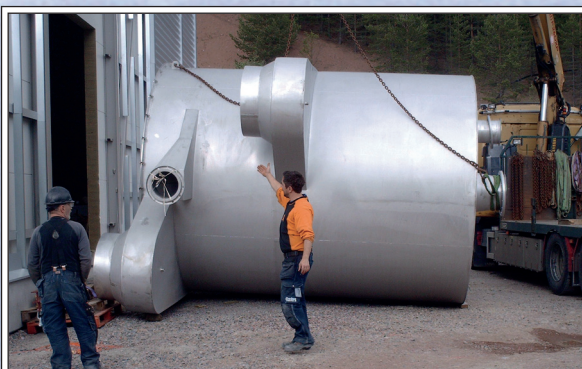
Distribution till pumpar