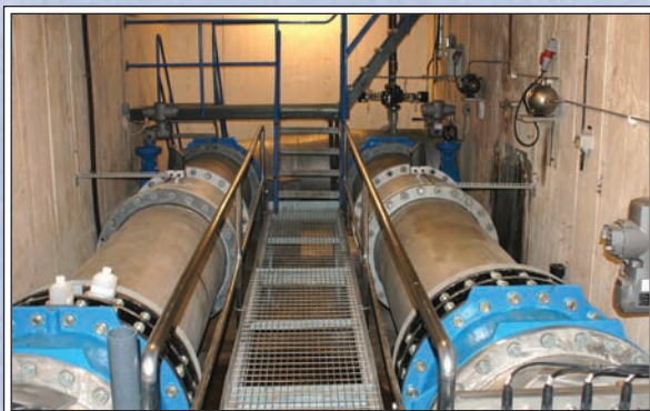
DN900 x t6

Stora delar av installationerna har förtillverkats i egen verkstad för att sedan snabbt och rationellt slutmonteras ute på arbetsplatsen i vattenverket. Rördimensionerna är DN900 x t6 i rostfritt stål.